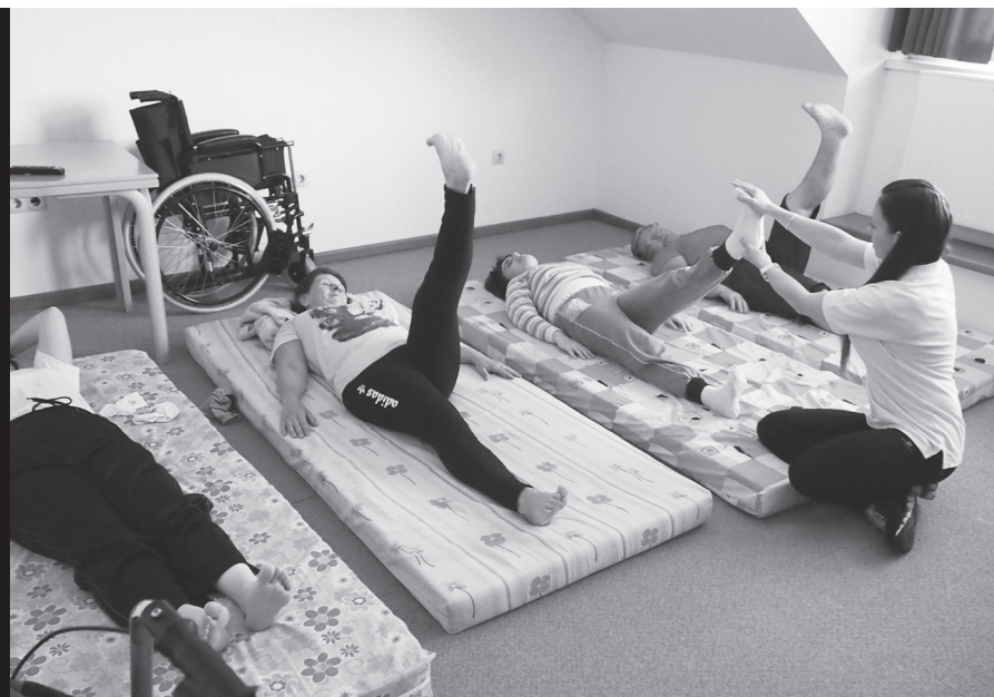
Das Haus der Versöhnung bietet Erholung und Therapie