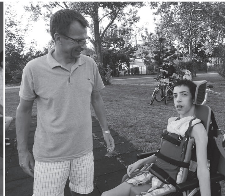
Entspannung für Vater und Sohn