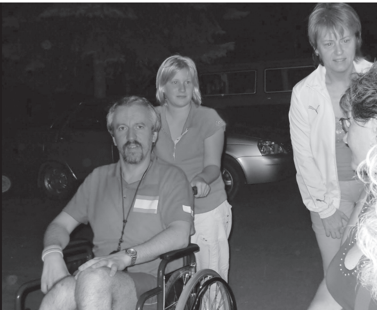
Ankunft im Haus der Versöhnung